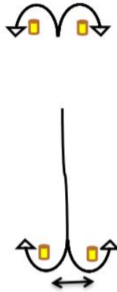
1:a läns och 2:a kryss

15 startande 90 m 20 startande 120 m 25 startande 150 m