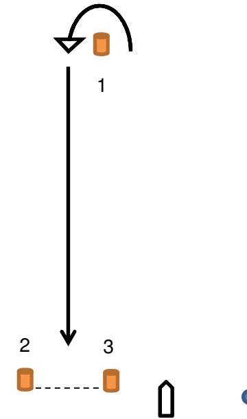
2:a läns och målgång